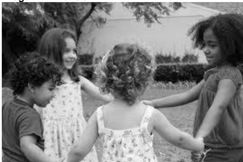
Imagem 1: Infância

IMAGENS, FIGURAS, TABELAS, GRÁFICOS, QUADRO: DEVEM TER TÍTULO E FONTE, CONFORME EXEMPLOS: